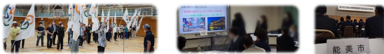
5/12 市民体育大会総合開会式