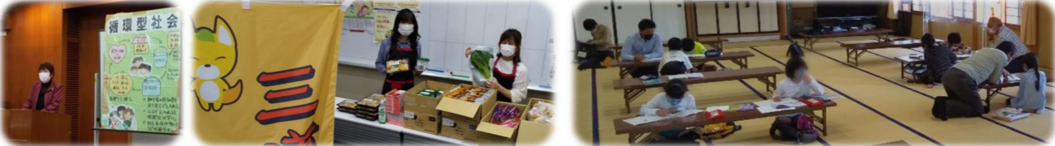
4/26 市民環境ネットワーク総会 4/26 三道山子ども食堂(生活応援) 5/7 三道山子ども食堂(スクール)