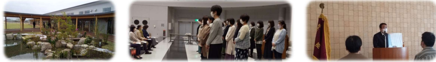
4/14 福島子ども園 竣工式