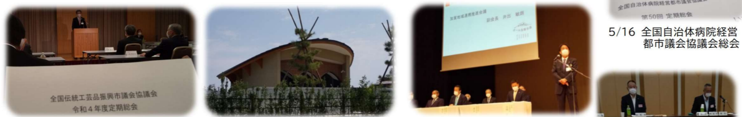
5/17 全国伝統工芸品振興市議会議長協議会 令和4年度定期総会