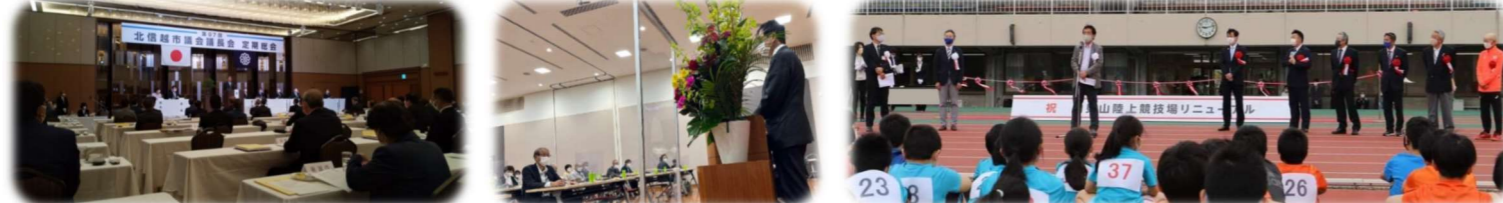
4/21 北信越市議会議長会 総会