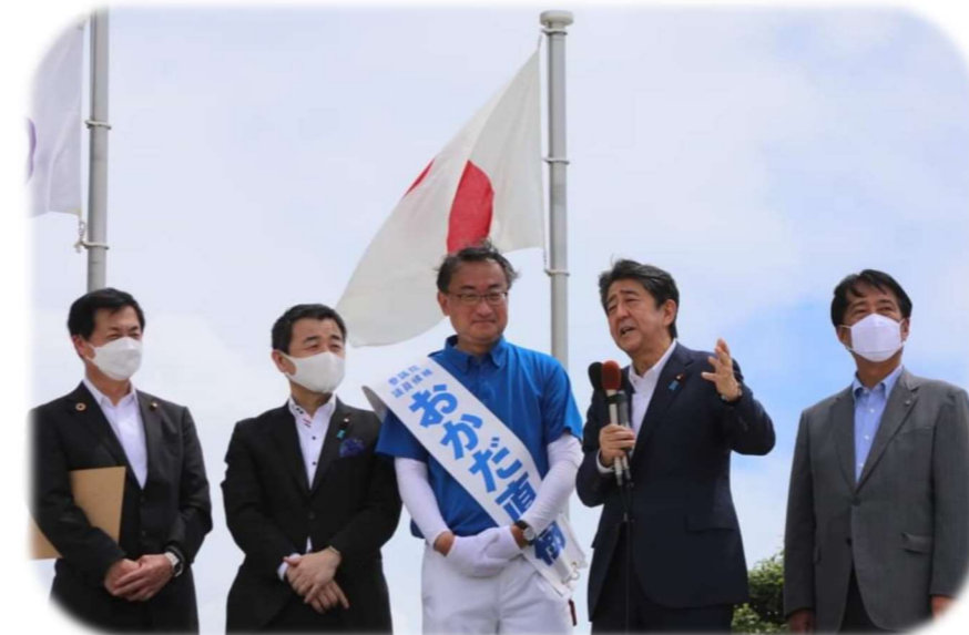
6/27 安倍晋三元首相 岡田直樹能美市応援演説

令和4年4月参議院議員補欠選挙 当選 宮本 周司・7月参議院議員選挙 当選 岡田 直樹