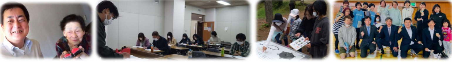
5/8 母の日 5/8 市トランポリン協会 総会 5/15 三道山町フォトウォークラリー 5/15 県エアロビク連盟