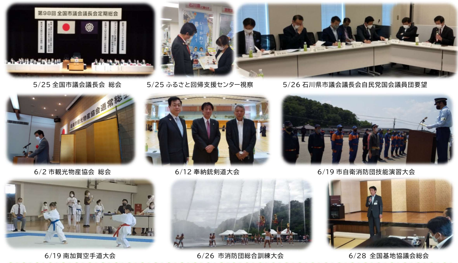
5/25 全国市議会議長会 総会