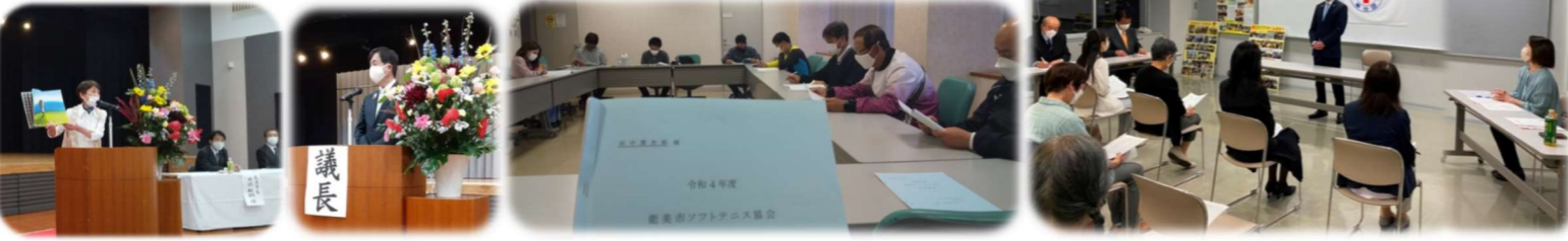
4/23 市ボランティア連絡協議会 総会 4/23 市ソフトテニス協会 総会 4/25 市赤十字奉仕団チーム20 総会