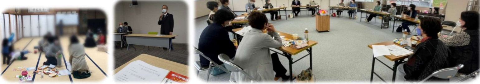
4/15 三道山子ども食堂 (居場所づくり) 4/20 県赤十字奉仕団総会 4/23 げんきかい総会 市政報告会