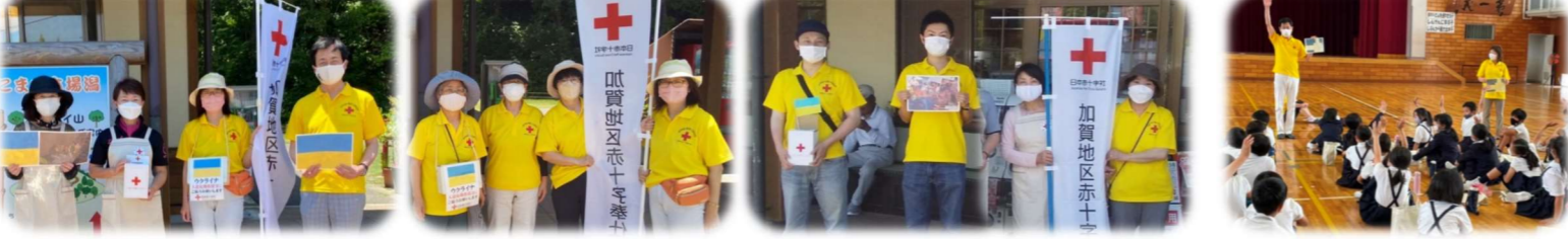
5/29 加賀地区赤十字奉仕団 ウクライナ人道支援募金活動 6/1 辰口中央小学校 福祉体験授業