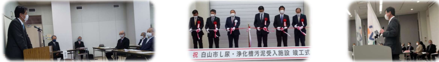
4/26 能美市政OB会 総会