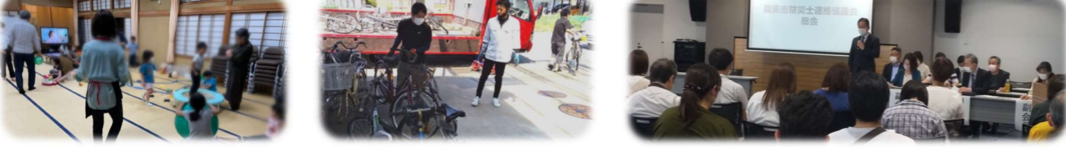
5/21 三道山子ども食堂(居場所づくり) 5/22 三道山町壮参会 奉仕作業 5/29 能美市防災士連絡協議会 総会