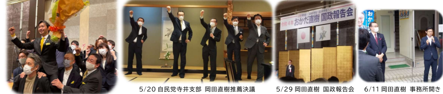
5/20 自民党寺井支部 岡田直樹推薦決議 5/29 岡田直樹 国政報告会 6/11 岡田直樹 事務所開き

令和4年4月参議院議員補欠選挙 当選 宮本 周司・7月参議院議員選挙 当選 岡田 直樹