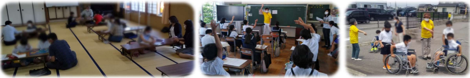
6/3 三道山子ども食堂(スクール) 6/9 湯野小学校 福祉体験授業 6/21 宮竹小学校 福祉体験授業