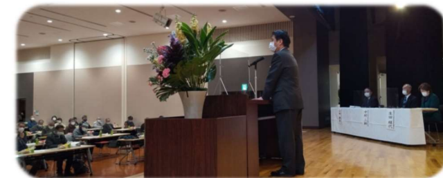
1/19 能美市民生委員児童委新年研修会