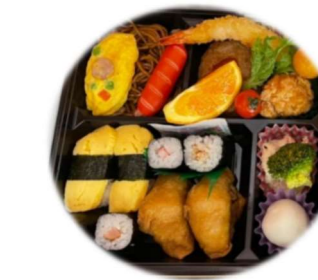
3/26 三道山子ども食堂 春休み子ども企画

ウクライナ 人道危機救援金に ご協力をお願いします 3月12日(木)10時～12時 場所 アルビス寺井店前 日本赤十字社 Japanese Red Cross Society 能美市赤十字奉仕団チーム20