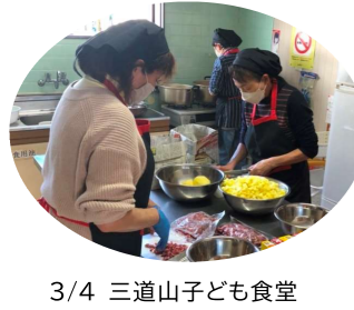
3/4 三道山子ども食堂