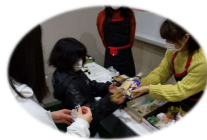
2/8 三道山子ども食堂