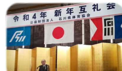
1/16 石川県体育協会新年互礼会