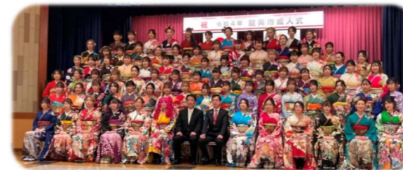
1/9 能美市成人式(寺井地区に臨席)