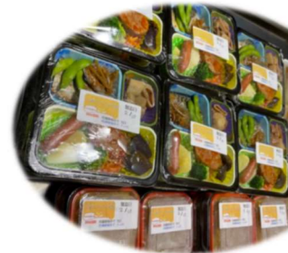
2/10 三道山子ども食堂