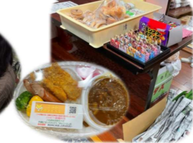
2/4 三道山子ども食堂