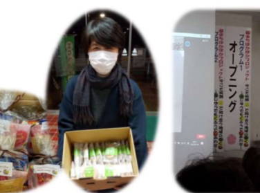
2/19 春まちぼかぼかプロジェクト