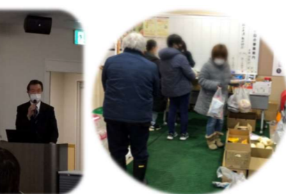
2/22 三道山子ども食堂