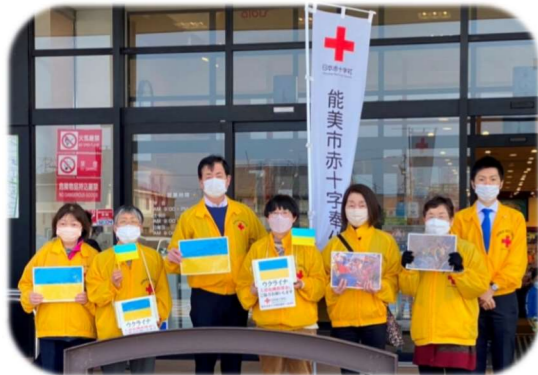
3/12 能美市赤十字奉仕団チーム20 ウクライナ救援金活動