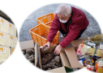
2/14 三道山子ども食堂に、たくさんの方からプレゼント