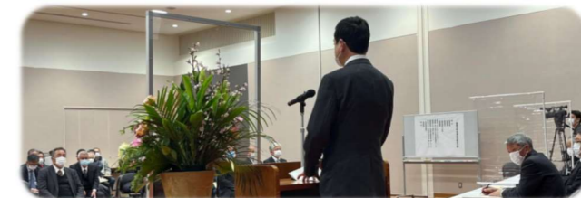
2/16 能美市町会連合会総会