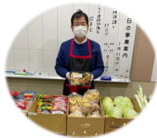
1/13 三道山子ども食堂