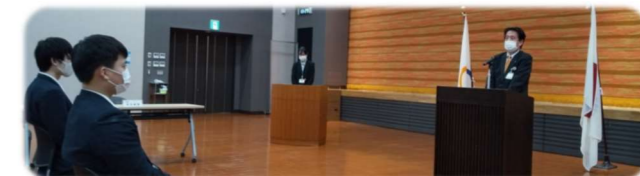
2/3 自衛隊入隊激励会