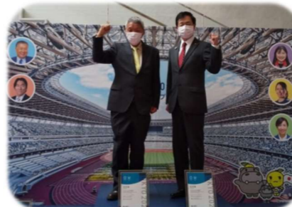
3/19 東京2020表彰台授与式