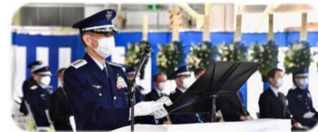
3/12 自衛隊員葬送式(小松基地撮影)