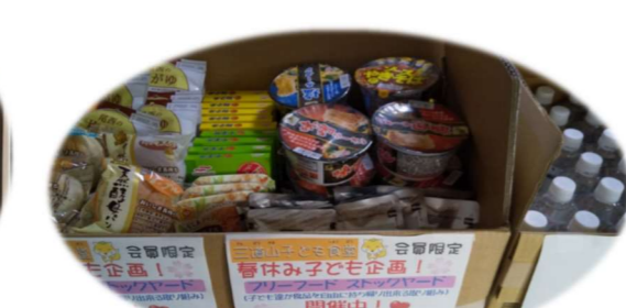
3/26～4/5 三道山子ども食堂フリーフードストックヤード (子どもが自由に食品を受け取れる取り組み)