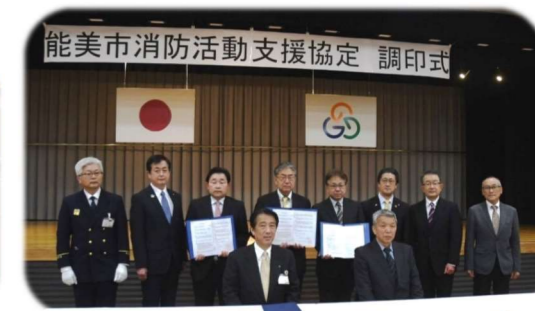
3/21 能美市消防活動支援協定調印式