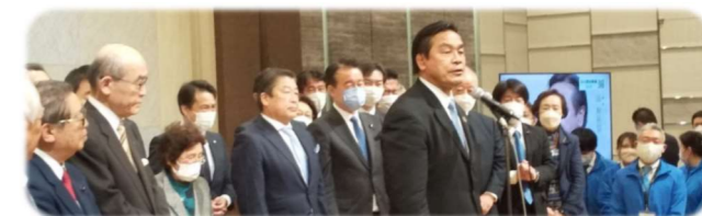
3/13 石川県知事選挙当選訪問