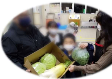
1/25 三道山子ども食堂