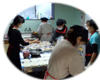
1/7 三道山子ども食堂