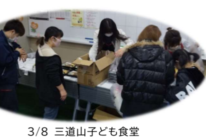
3/8 三道山子ども食堂