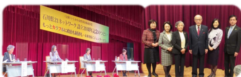
1/23 石川県21ネットワーク 20周年のつどい