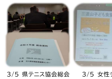
3/5 県テニス協会総会