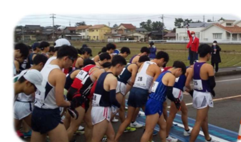
3/20 全日本競歩能美大会